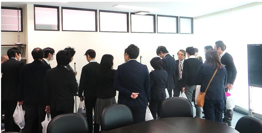
B'zマイクスタンドの観覧