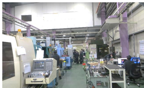
協和精工(株) 工場視察