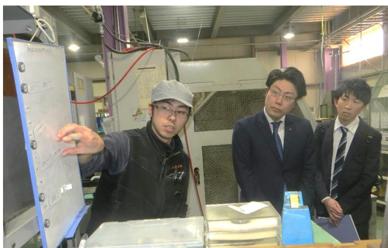
協和精工(株) 工場視察