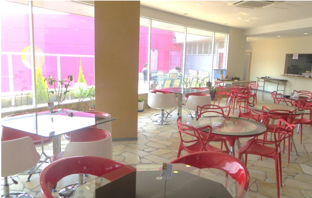
会社内のレストラン