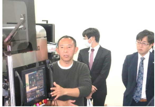
錠剤検査マシンの仕組みについてご説明